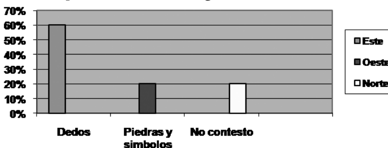
Figura No. 1. Consideración de los docentes sobre la base etimológica del que surge el sistema numérico miskitu.

Producto del procesamiento de los instrumentos aplicados, se obtuvo los resultados que se presentan en las figuras del 1 al 3, referidos a la base del sistema de numeración miskitu, desde el punto de vista etimológico.