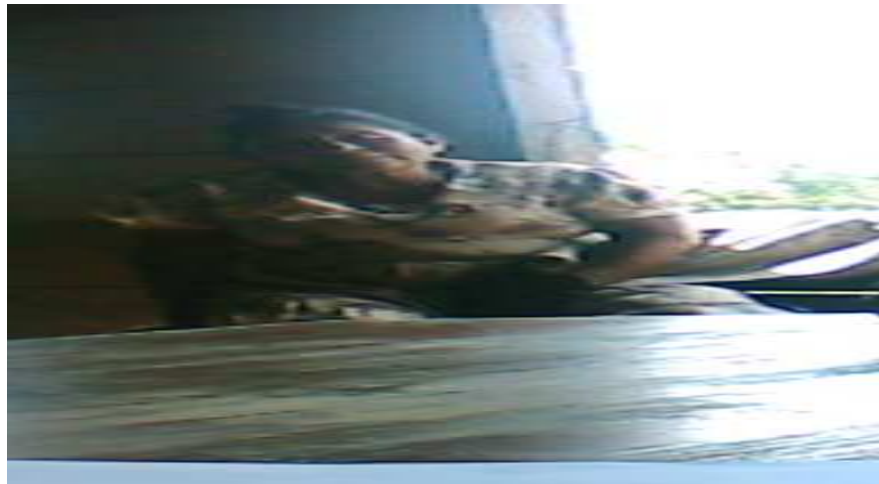
Entrevista realizada a una partera Mayangna de la comunidad de Sakalwas. Fotografía tomada por: Carlos Olivera el día 20 de abril del 2008.