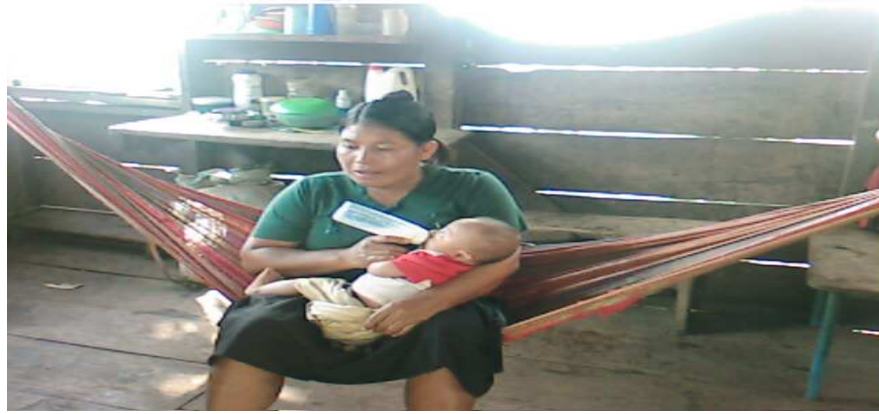
Entrevista realizada a una comunitaria de Sakalwas. el día 20 de abril del 2008.