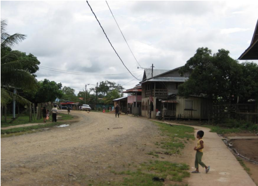
Calle céntrica de la comunidad de Sahsa.