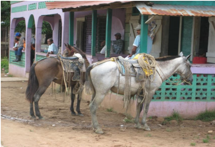
Caballo de campesinos Mestizos en la comunidad de Sahsa.