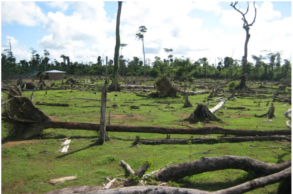
Parcela actual de campesinos en el noreste de la comunidad de Sahsa.