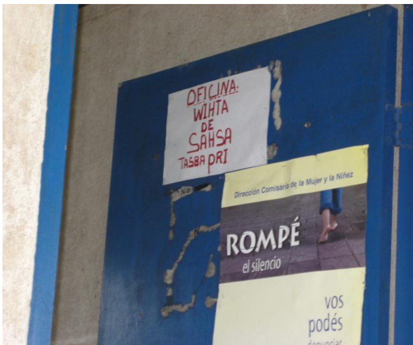
Oficina del Wihta de la comunidad de Sahsa.