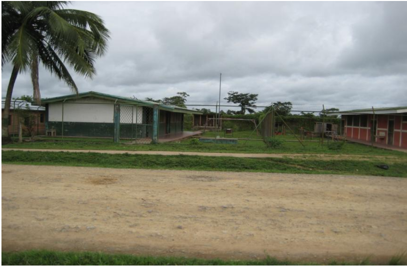
Escuela y comedor de la comunidad de Sahsa.