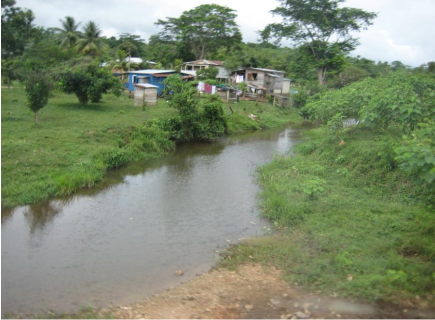
Estado actual del río de la comunidad de Sahsa.