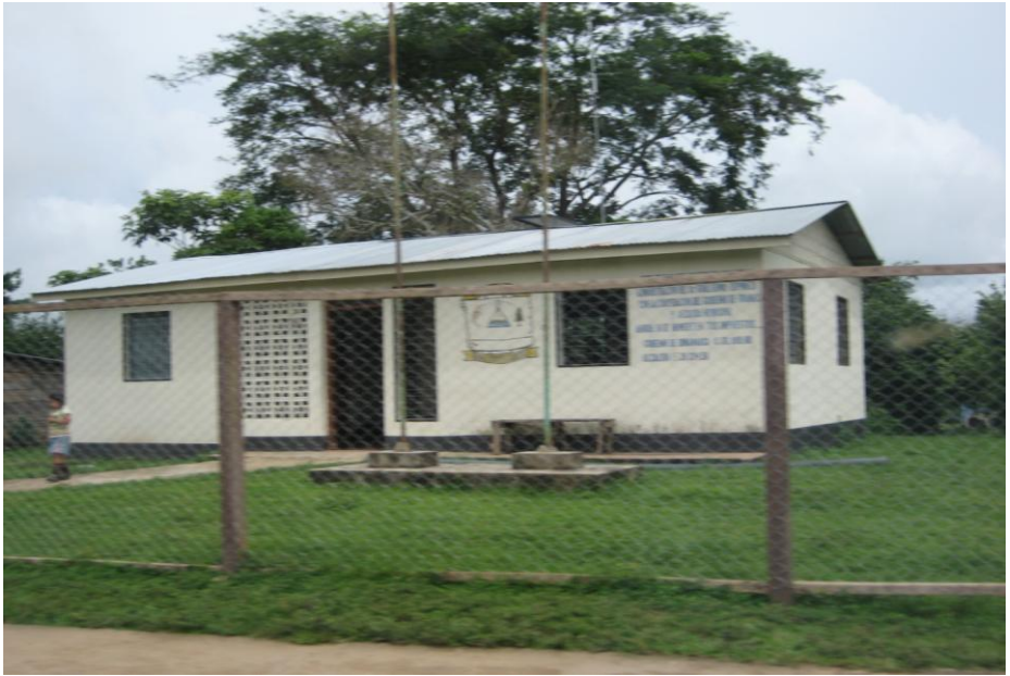
Alcaldía Territorial de la comunidad de Sahsa.