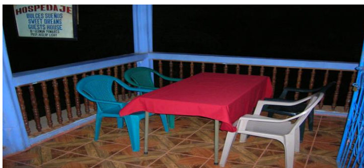
Balcón en la parte frontal del edificio