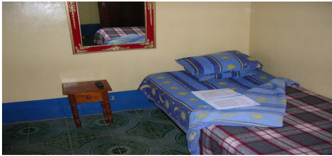
Habitación con cama unipersonal