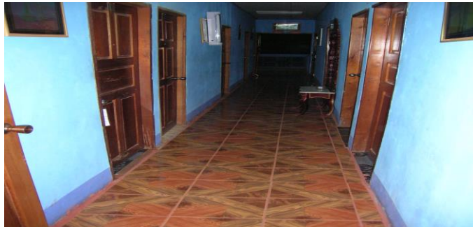
Pasillo de la planta alta del hospedaje