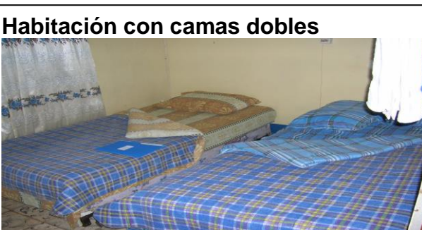
Habitación con camas dobles