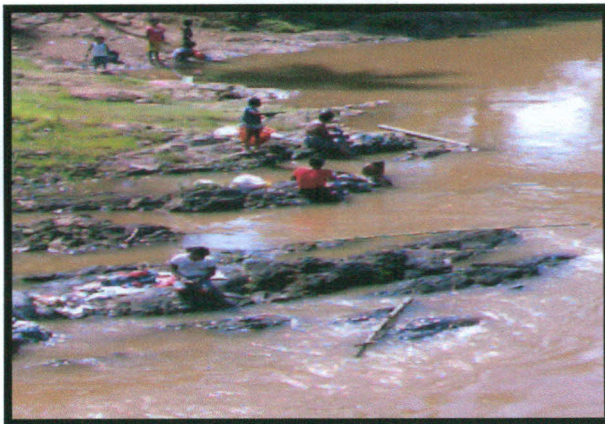
Fotografía No. 2 Mujeres de la comunidad de Bambana Rosita, lugar donde las mujeres lavan las ropas y acarrean agua para limpiar la casa. Tomada por Lilia Montoya Leal, El 29 de septiembre 2007