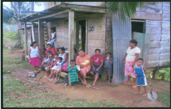
Fotografía No. 5. Conversación con mujeres en la comunidad de Españolina Municipio de Bonanza. Tomada por Sandiel Castro, febrero 2008,