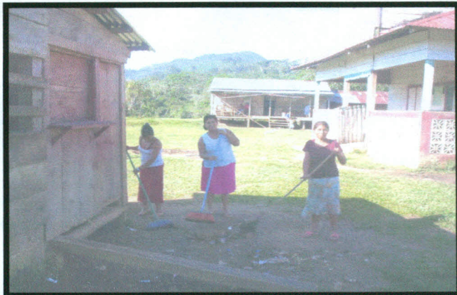
Fotografía No. 6. Tomada por Sandiel Castro, febrero 2008, en la comunidad de Españolina Municipio de Bonanza, Mujeres realizando limpieza en los lugares comunales.