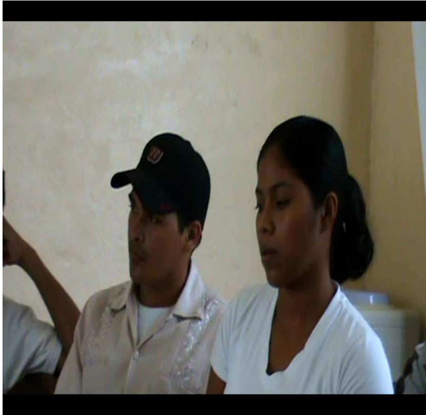
Estudiantes mestizo de V año de Administración de Empresas, participando en grupo focal.