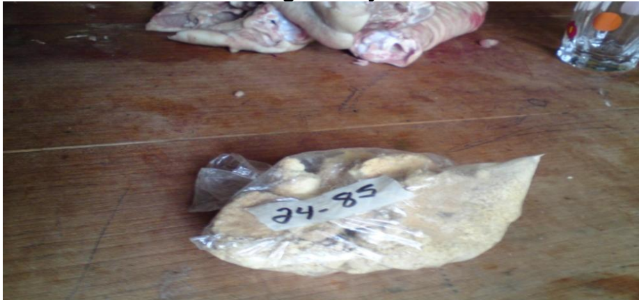
Fotografía No 3. Productos que comercializan las mujeres organizadas “Las Primaveras” de Danly Arriba, estas son galletas. Tomada por Gilberto Artola, 23 de Noviembre del 2010.