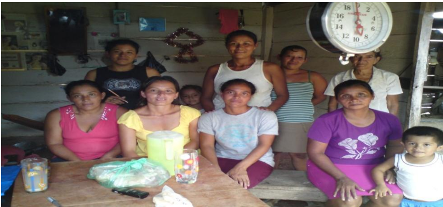
Fotografía No 2. Mujeres de la junta directiva de la organización “Las Primaveras”. Tomada por Gilberto Artola, 23 de Noviembre del 2010.