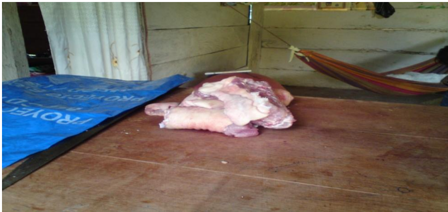
Fotografía No 4. Carné que comercializan las mujeres organizadas. 23 de Noviembre.