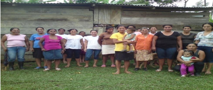
Fotografía No 1. Mujeres que integran la organización “Las Primaveras” de la comunidad Danly Arriba, después de haber realizado reunión extraoficial. 27 de Noviembre del 2010.