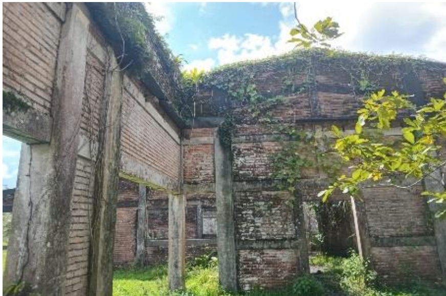
Figura 5: Ruinas del Escuela Técnica vs Base militar en Comunidad Los Pintos

Foto tomada por Olver Ramos (enero 2025)