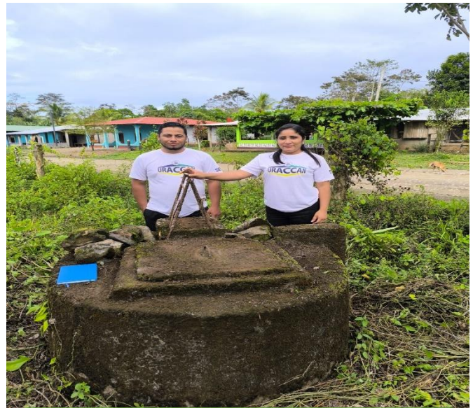
Figura 14: Primer pozo comunal construido en la comunidad Los Pintos en el año 1992