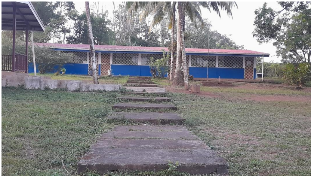
Figura 9: Escuela Violeta Barrios de Chamorro

Foto tomada por Olver Ramos (noviembre 2024)