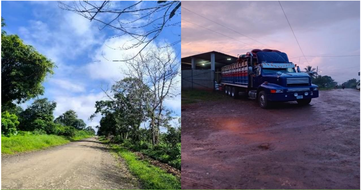
Figura 4: Vías de transporte de la comunidad Los Pintos