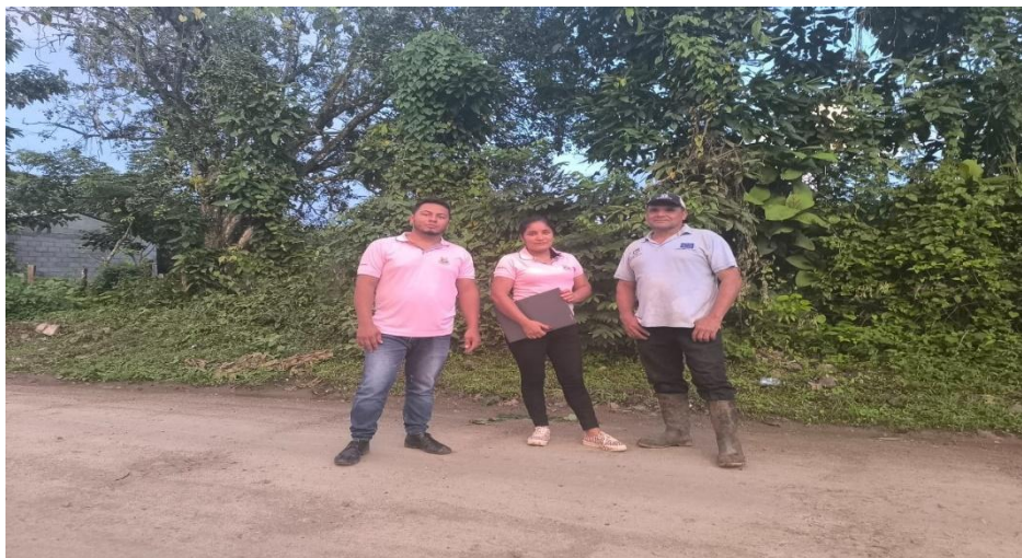
Figura 3: Hijo de fundador de la comunidad Los Pintos Foto tomada por Noryeli Ramos (noviembre 2024)