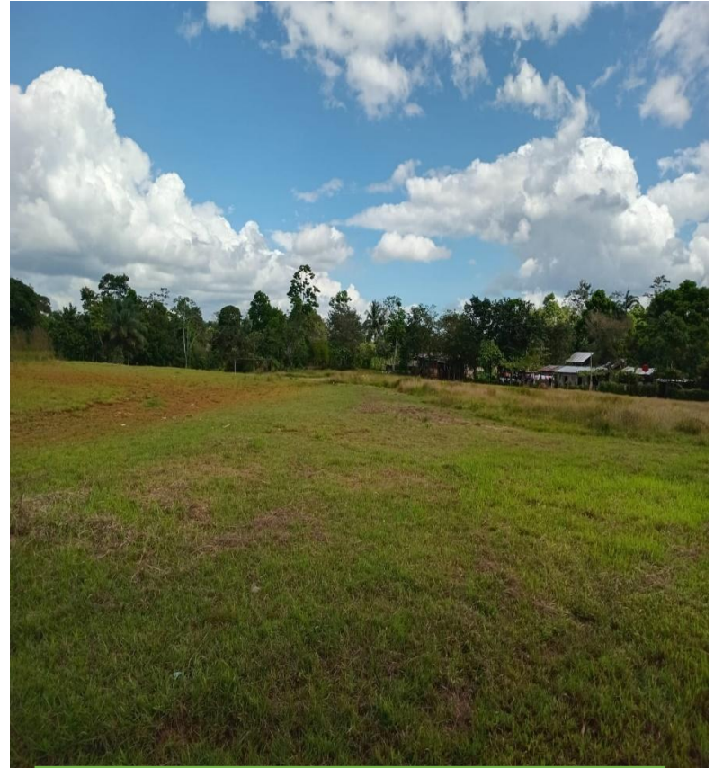
Figura 10: Cuadro deportivo comunidad Los Pintos foto tomada por Olver Ramos (febrero 2025)