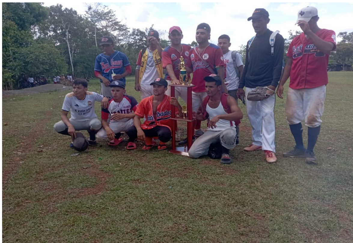
Figura 16: Equipo de béisbol de la comunidad Los Pintos

Foto tomada por Olver Ramos (28-04-2025)