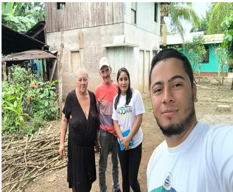
Figura 15: Fundadores de la comunidad Los Pintos

(28-04-2025)