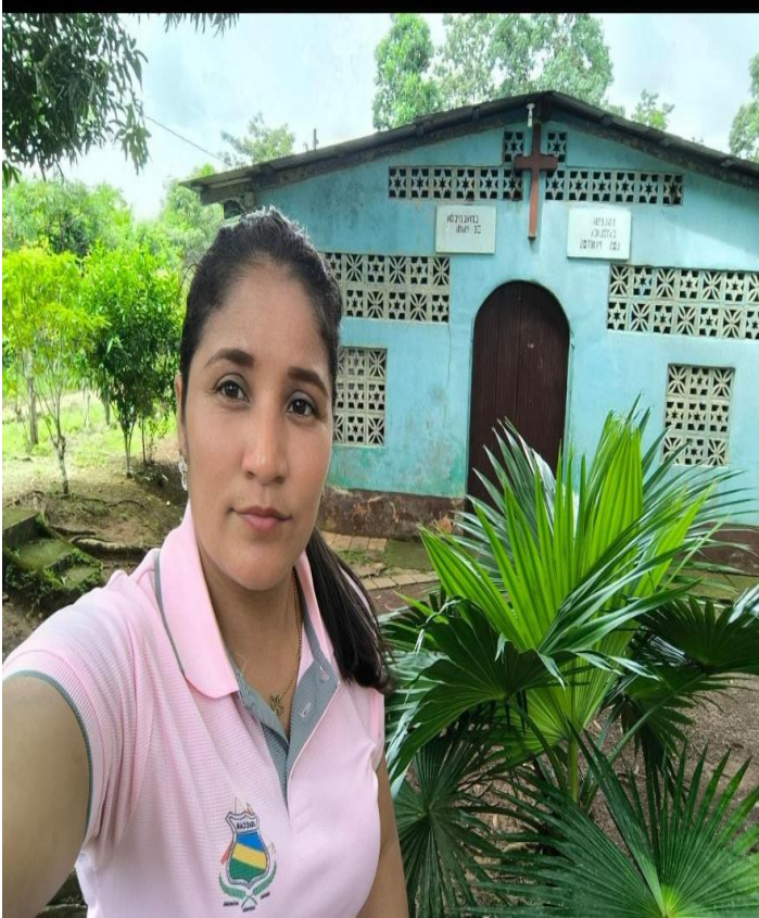
Figura 10 Iglesia católica foto tomada por Adela Báez (2024)