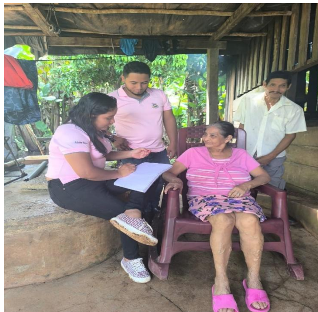
Figura 2: Fundadora de comunidad los Pintos Foto tomada por Yuridia Morales (noviembre2024)