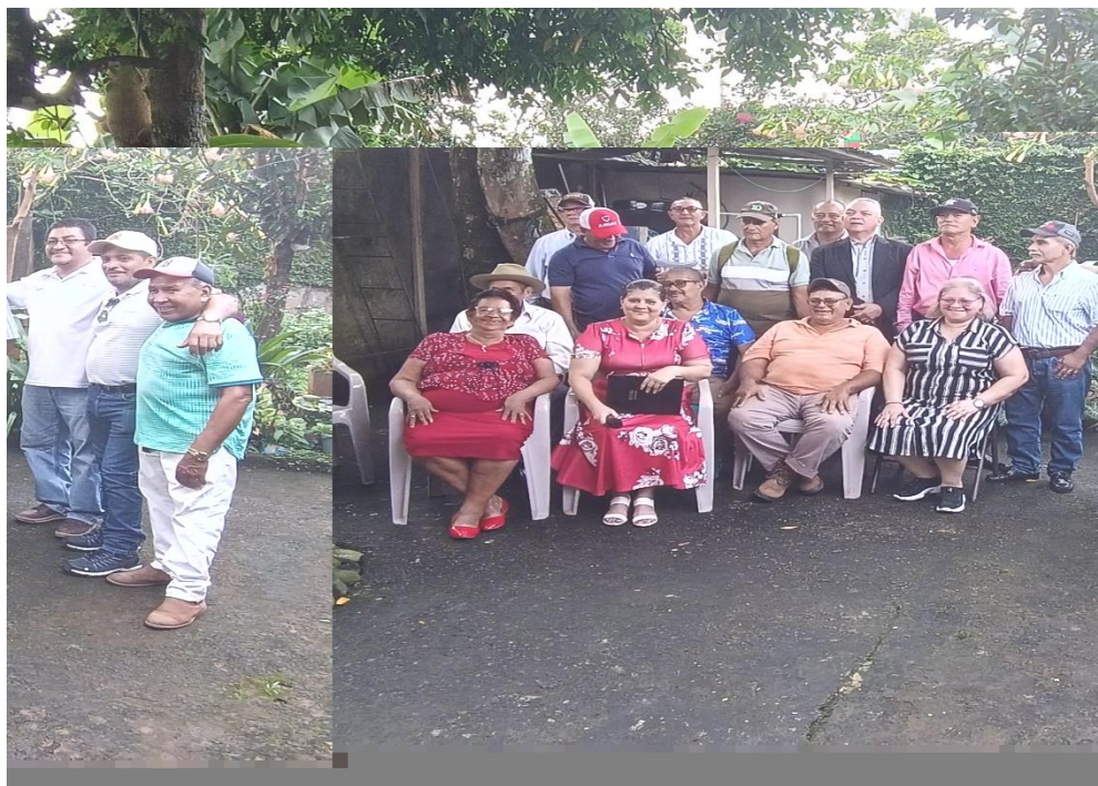
Figura 6: Fotos de los ex estudiantes de la escuela técnica agropecuaria de Los Pintos en los años 70

Foto tomada por Ing. Pablo Espinoza (2024)