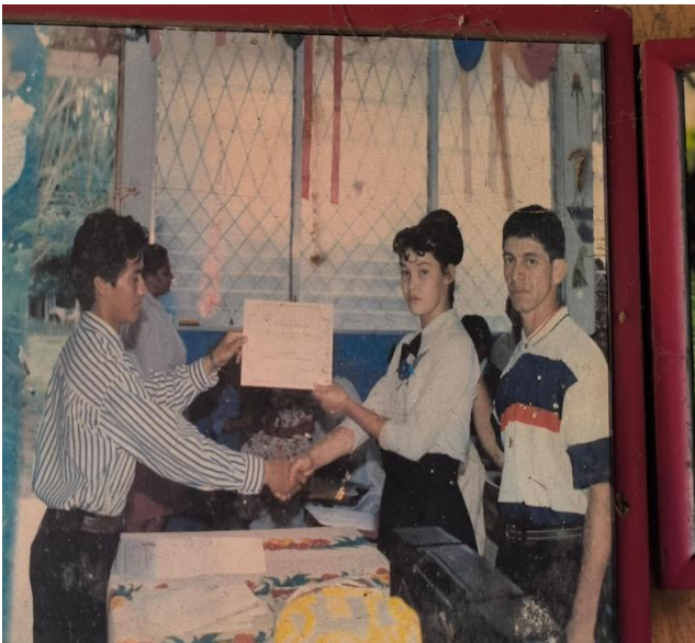
Figura 13: Promoción en la escuela Violeta Barrios en el año 1998 (fotógrafo anónimo)

Fotos tomadas por Adela Báez (28-04-2025)