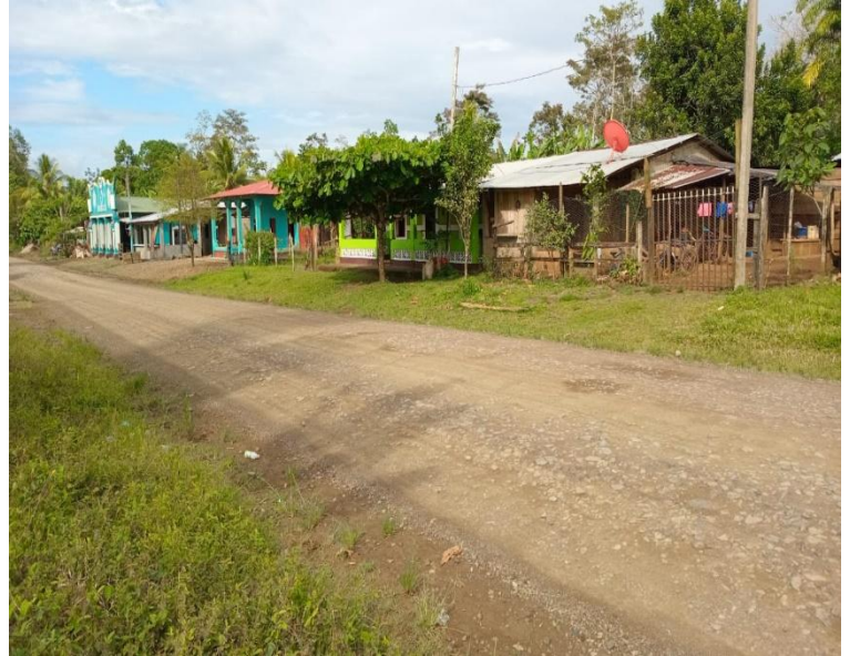
Figura 12: La imagen de la izquierda es una Casa con diseño de infraestructura antigua de Los Pintos y la imagen de la derecha es la comunidad en la actualidad.

Fotos tomadas por Adela Báez (28-04-2025)