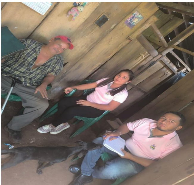
Figura 1: Fundador de la comunidad Los pintos Foto tomada por Elvi Moreno (noviembre 2024)