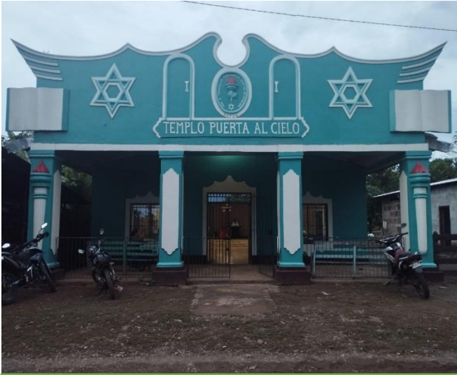
Figura 7: Iglesia AMEPUN

Foto tomada por Adela Báez (noviembre 2024)