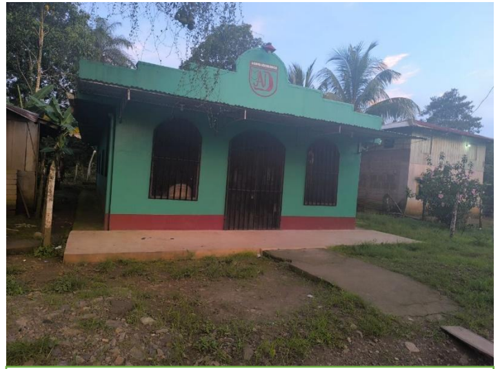
Figura 8: Iglesia Asambleas de Dios

Foto tomada por Adela Báez (noviembre 2024)