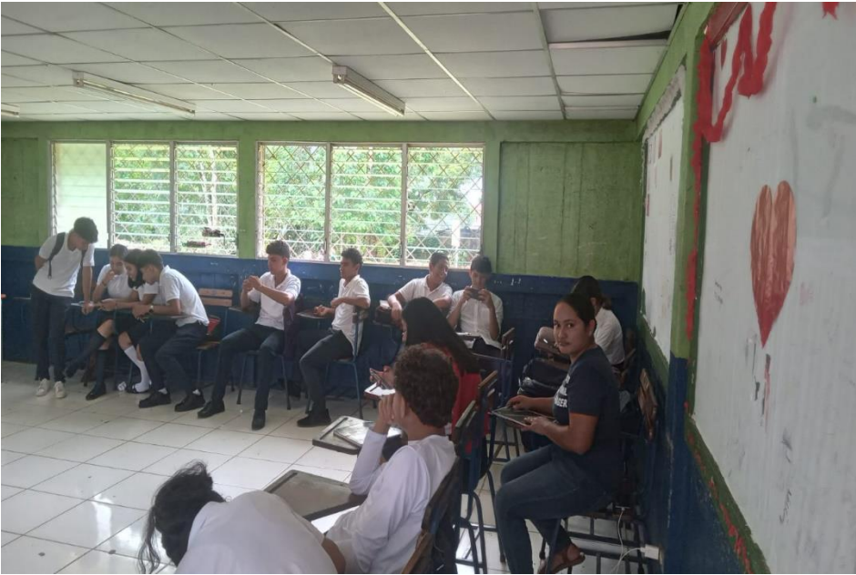
Figura 4. Observación a estudiantes y Docente (Fotografía: Eneyda Velásquez, 12 de septiembre de 2023).