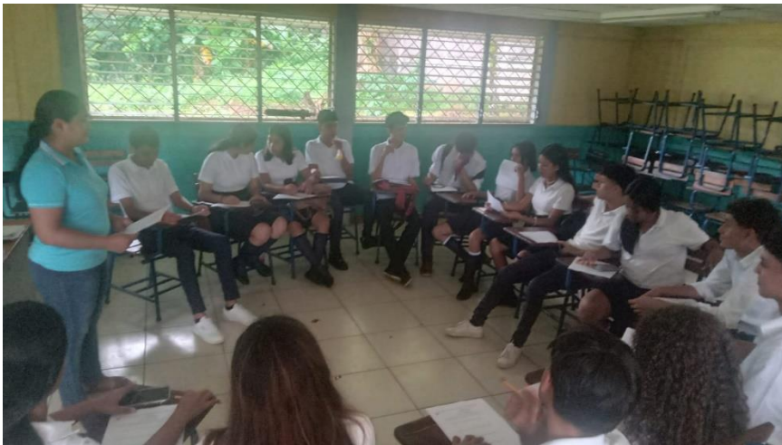
Figura 3. Aplicación de guía grupo focal a estudiantes (8 de septiembre de 2023).