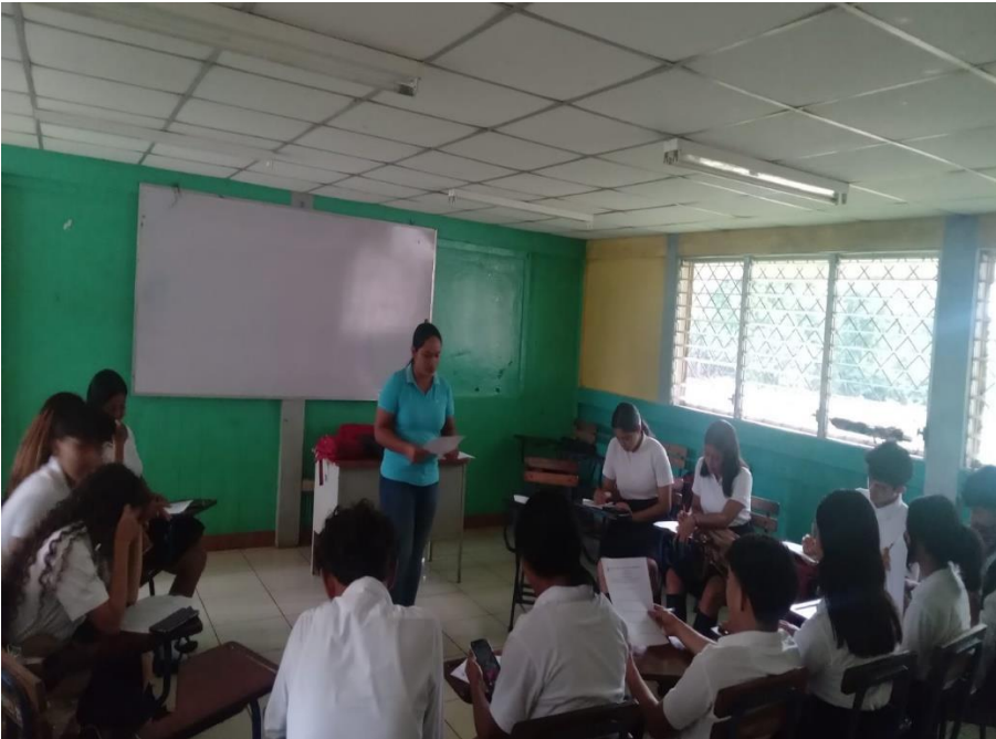
Figura 2. Aplicación de grupo focal a estudiantes (Fotografía: Eneyda Velásquez, 8 de septiembre de 2023).