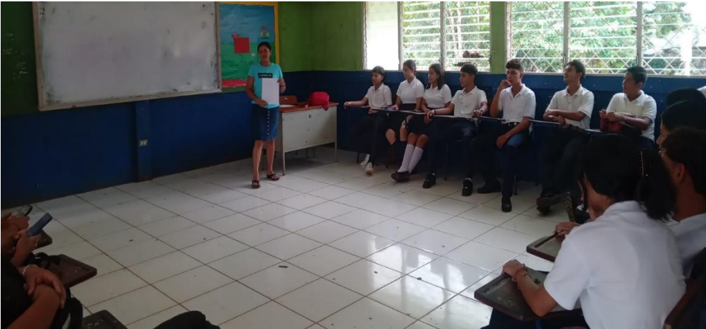
Figura 6. Aplicación de la guía test a estudiantes de décimo grado vespertino (Fotografía: Xiomara Orozco, 22 de septiembre de 2023).