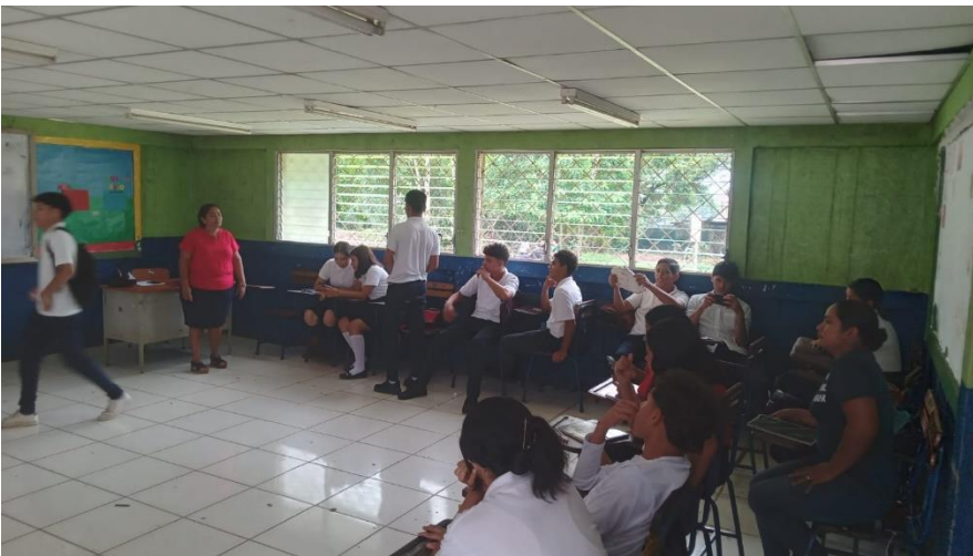
Figura 5. Observación a estudiantes y Docente (12 de septiembre de 2023).