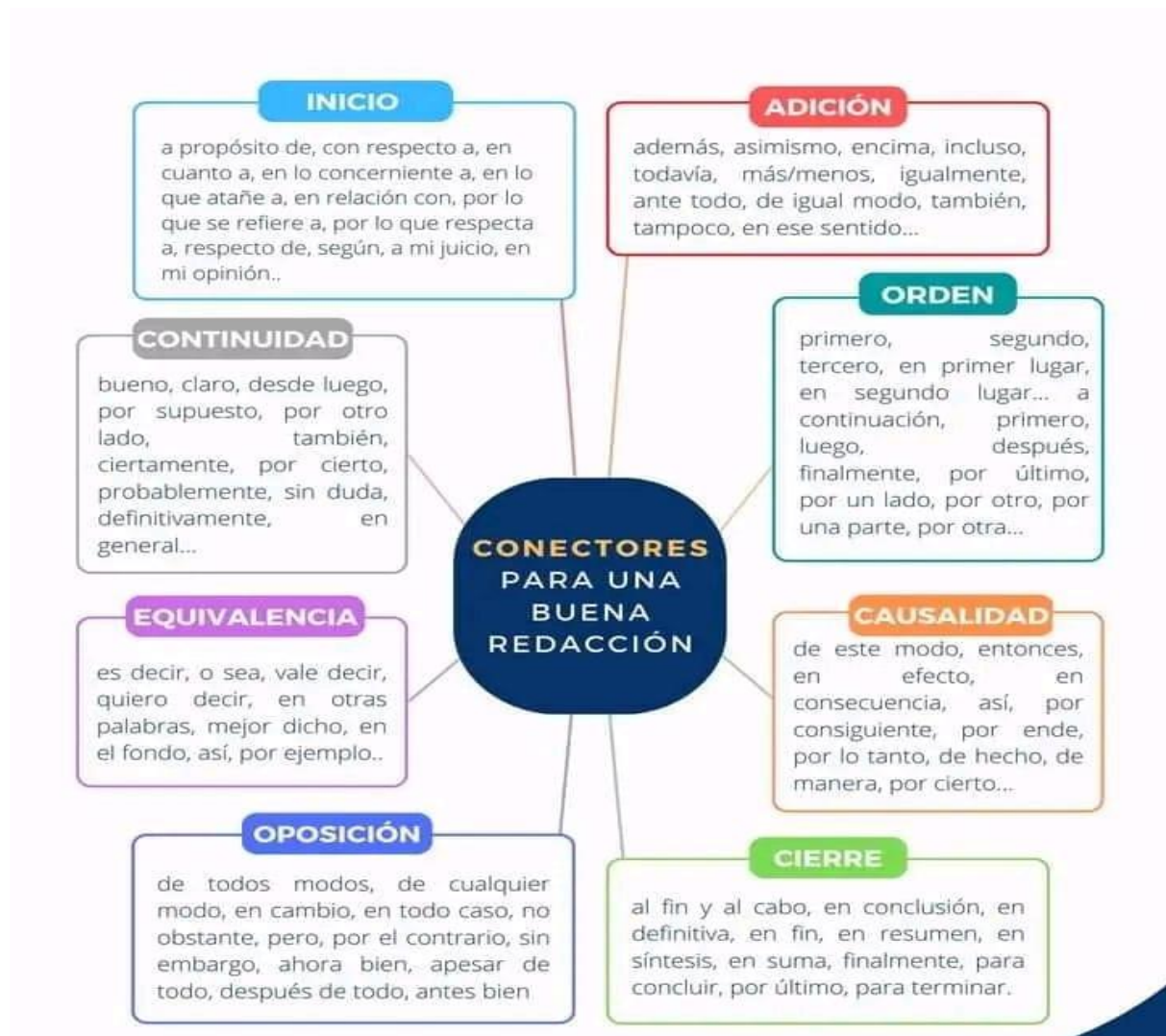
Figura 1. Conectores de la redacción de ensayo

Cruz, (2014), explica los diferentes tipos de conectores que se pueden utilizar en la redacción