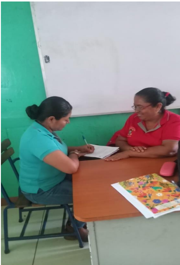
Figura 1. Aplicación de entrevista a la docente (8 de septiembre de 2023).