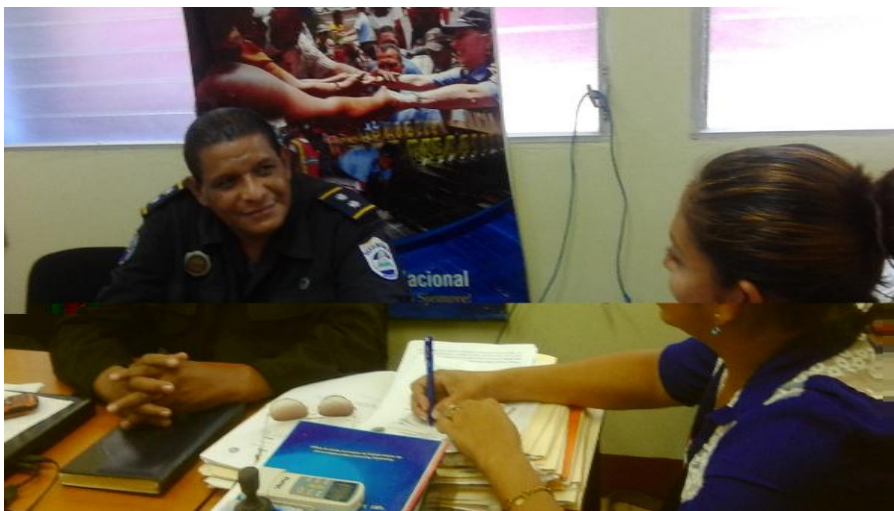
Entrevista a Jefe de delegación policial. Tomada por Méndez D. 17/03/16