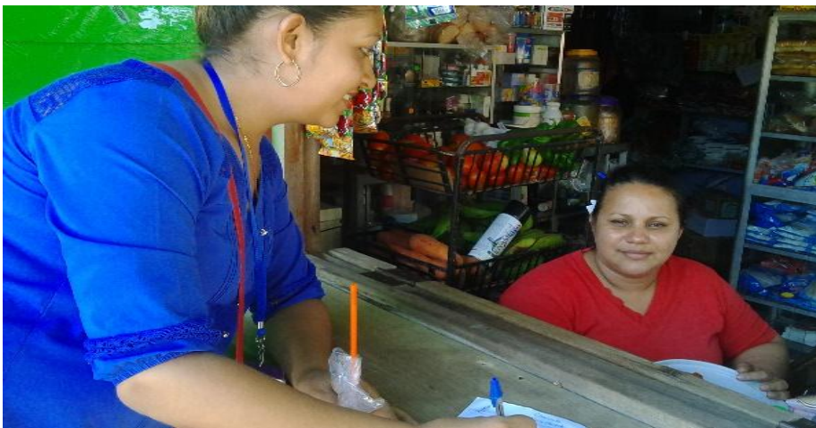
Foto de la entrevista a comerciante. Tomada por D. Méndez 16/03/2016