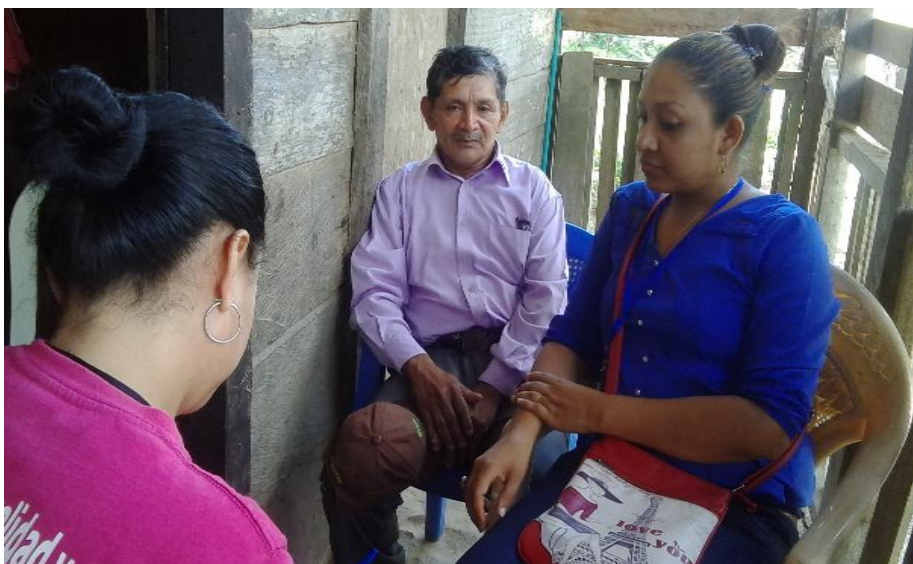
Entrevista a líder religioso. Tomada por González R. 16/03/16