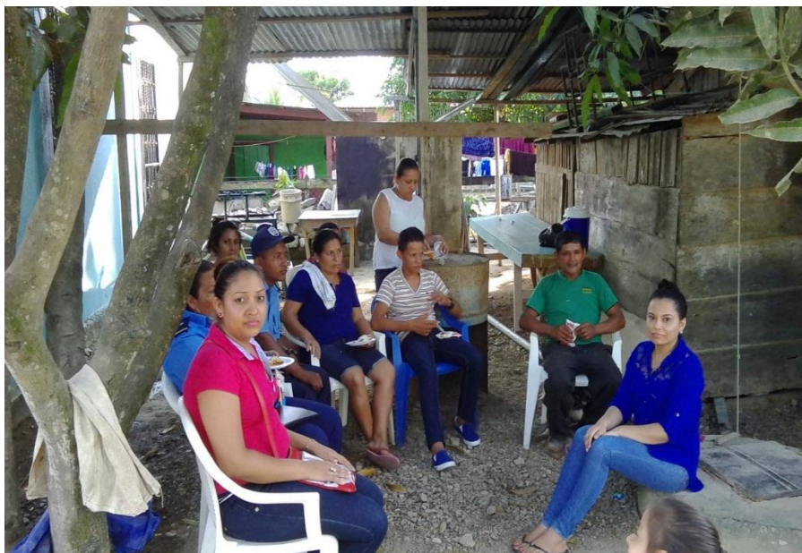
Grupo focal en el predio de la iglesia Esposa del Cordero. 21/03/16