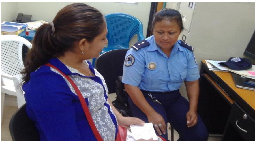
Entrevista a Jefa de sector. Tomada por Méndez D. 17/03/16