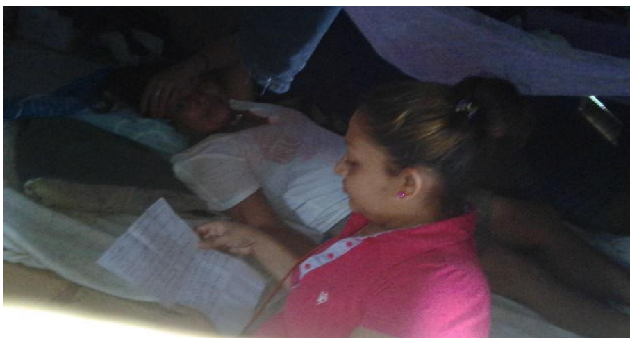
Entrevista a madres de familia. Tomada por Méndez D. 15/03/16