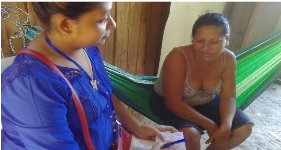
Entrevista a representante de barrio. Tomada por Méndez D. 16/03/16