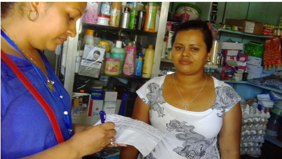
Entrevista a comerciante. 16/03/2016