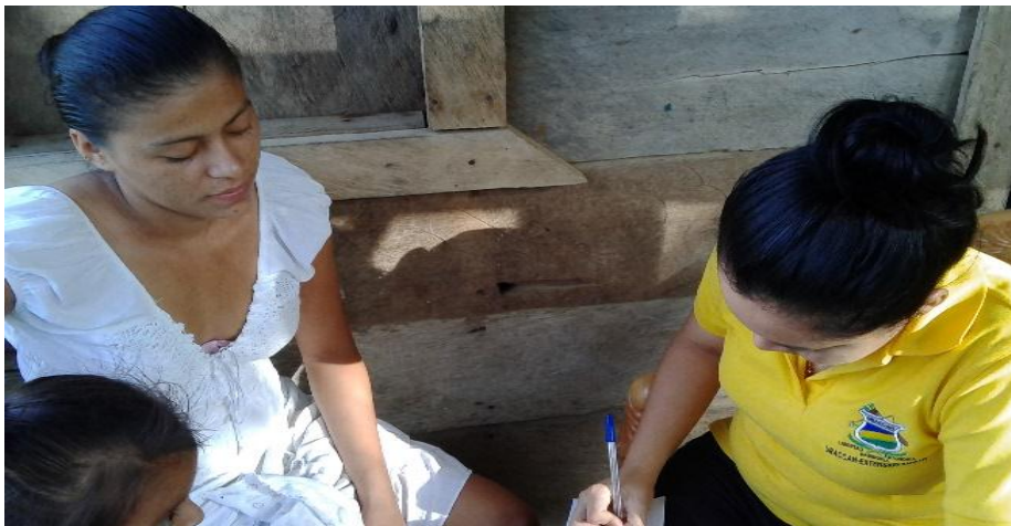
Entrevista a pobladora del barrio. Tomada por Centeno M. 15/03/16