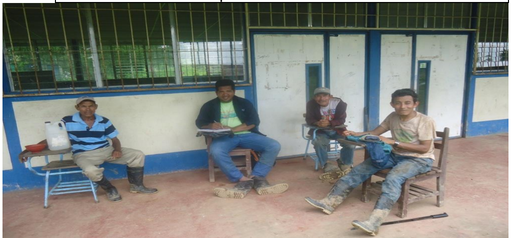
Entrevista a grupos focales con comunitario de la comunidad Kalmata. Tomada por F. Orozco. 20/01/2016