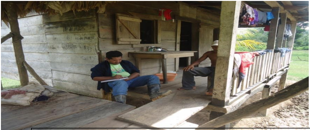
Entrevista a líder comunitario de la comunidad Kalmata. Tomada por F. Orozco. 20/01/2016