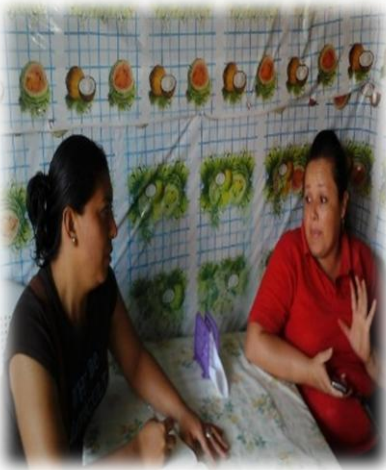
Foto #2 , Aplicando entrevista a joven que habita en uno de los barrios del área urbana de la ciudad de Waslala foto tomada por Tórrez Karel el 06 de Julio del año 2015