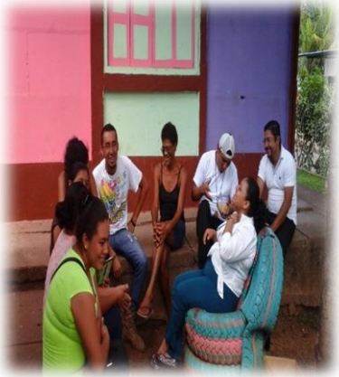
Foto # 1 Aplicando entrevista a pobladores del área urbana de la ciudad de Waslala, abordando los patrones culturales en nuestra ciudad de Waslala foto tomada Urbina Evelio el 30 de Agosto del año 2015