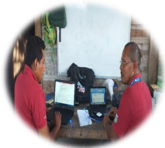
Recopilacion de Informacion