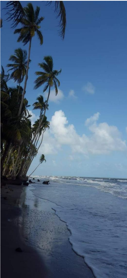
Playa de la comunidad de Haulover antes del impacto de los huracanes.