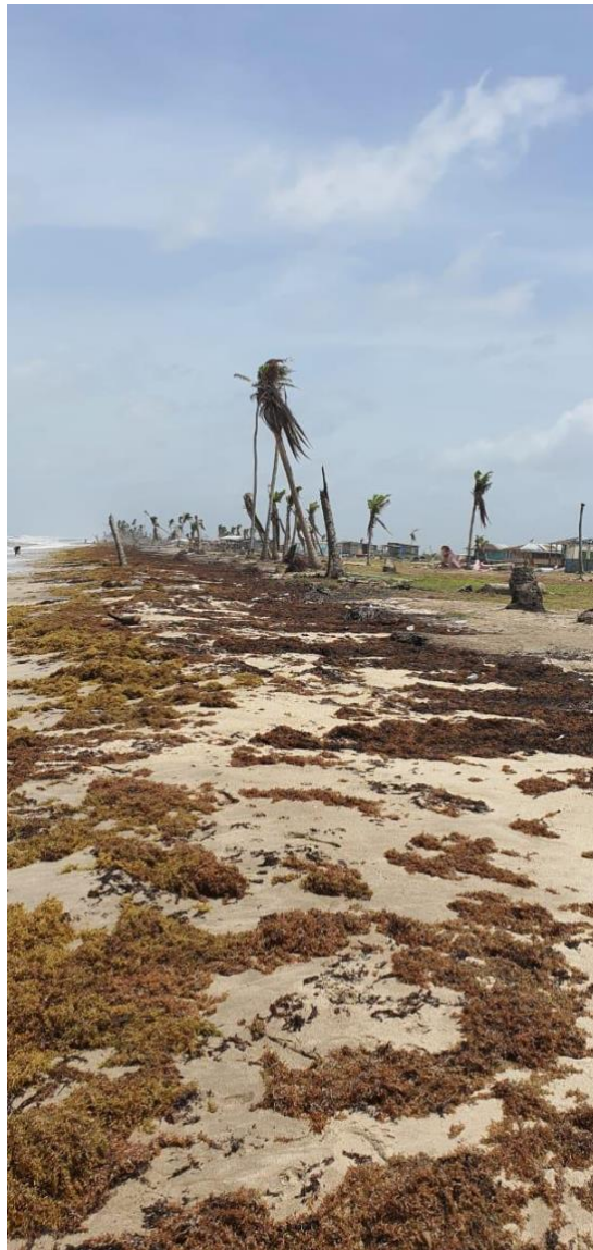
Rimm Mayorga Playa después de los huracanes.