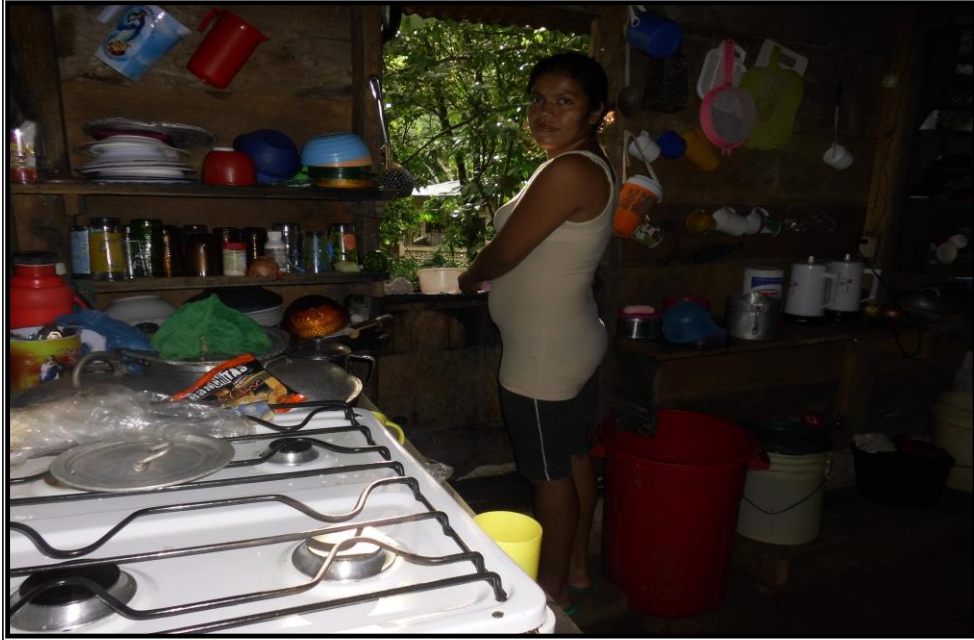
Fotografía 3: Madre soltera del barrio Rigoberto López Pérez realizando actividades doméstica en el hogar de su familiar (madre) donde actualmente habita. . Tomada por Dania Lam el 04 de Diciembre 2013.