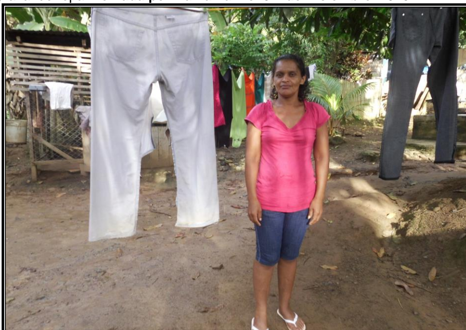
Fotografía 2: Madre soltera del barrio Rigoberto López Pérez de oficio docente en comunidad rural, cumpliendo con actividad domestica del hogar, lavado de ropa. Tomada por Dania Lam el 04 de Diciembre 2013.