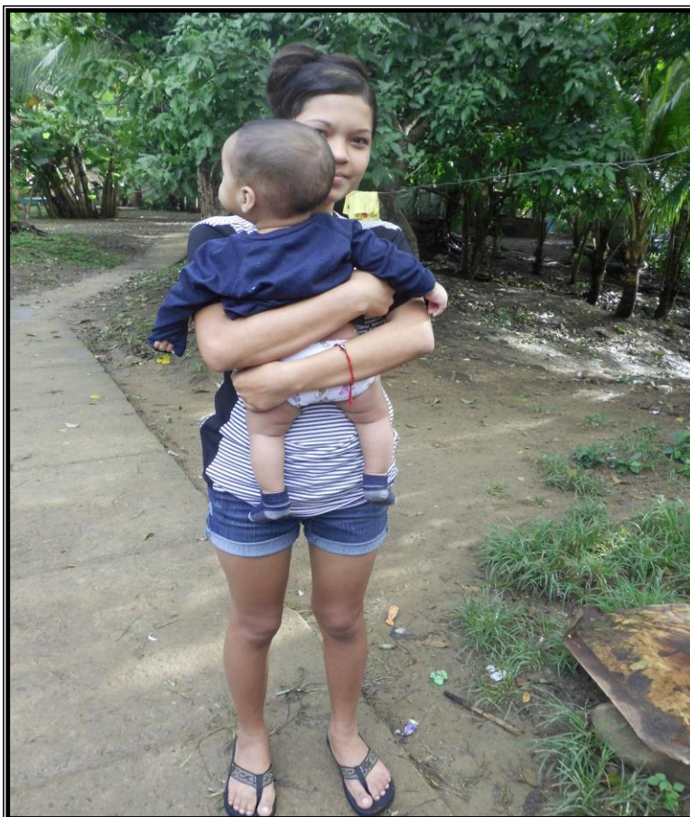
Fotografía 4 : Madre soltera Adolescente del barrio Rigoberto López Pérez sosteniendo en brazos a hijo de 6 meses de edad. . Tomada por Dania Lam el 04 de Diciembre 2013.