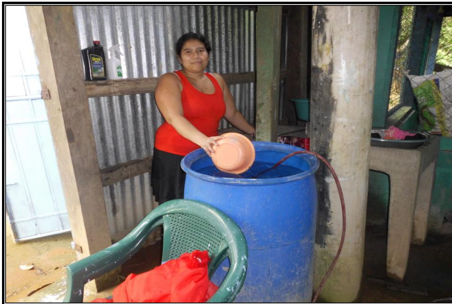
Fotografía 1: Madre soltera del barrio Rigoberto López Pérez realizando actividad laboral doméstica, lavando ropa. Tomada por Dania Lam el 04 de Diciembre 2013.