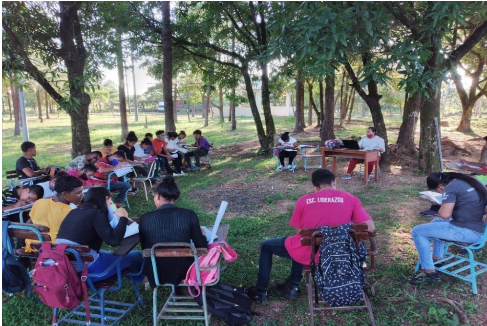
Estudiantes de la Escuela de Liderazgo en clase