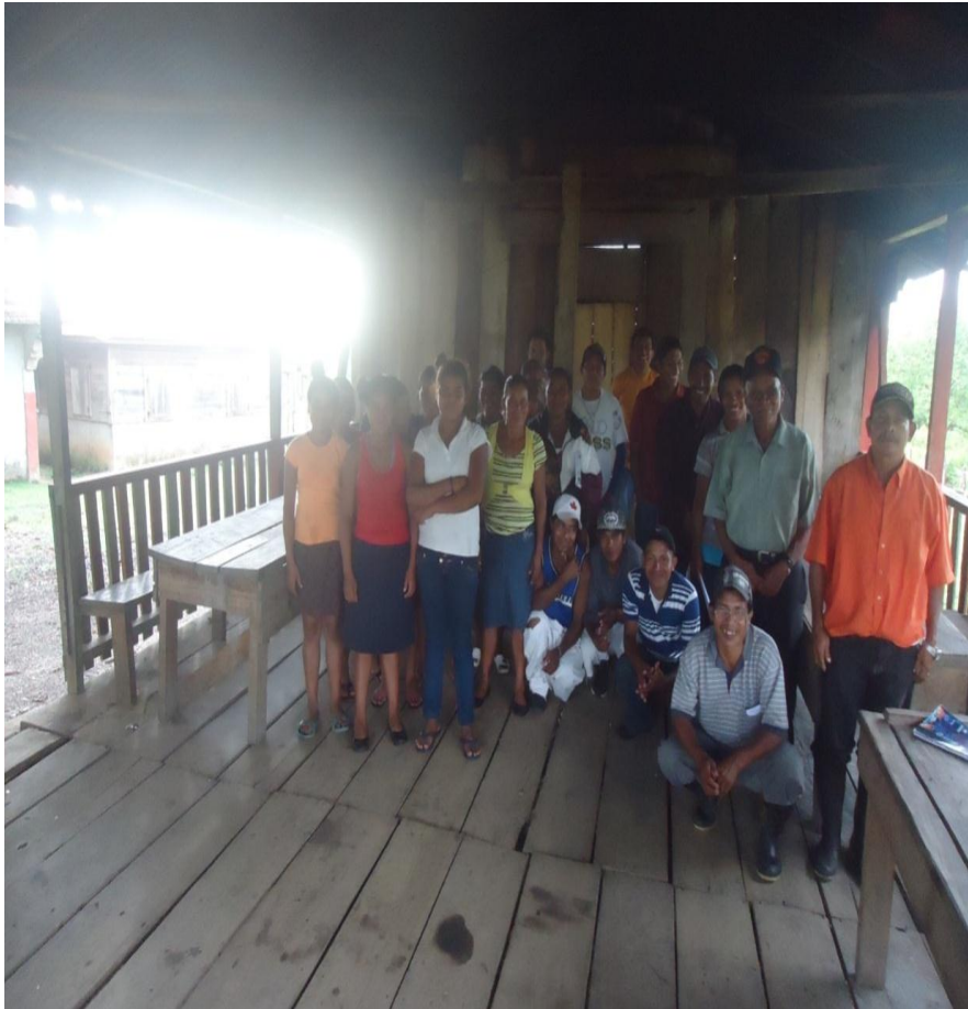
Foto 5. Parte de los participantes, comunitarios de AMASAU. Mayo 2016