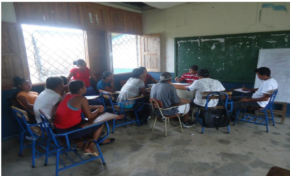
Foto 1. Grupo Focal con jóvenes Awastigni. Mayo 2016.