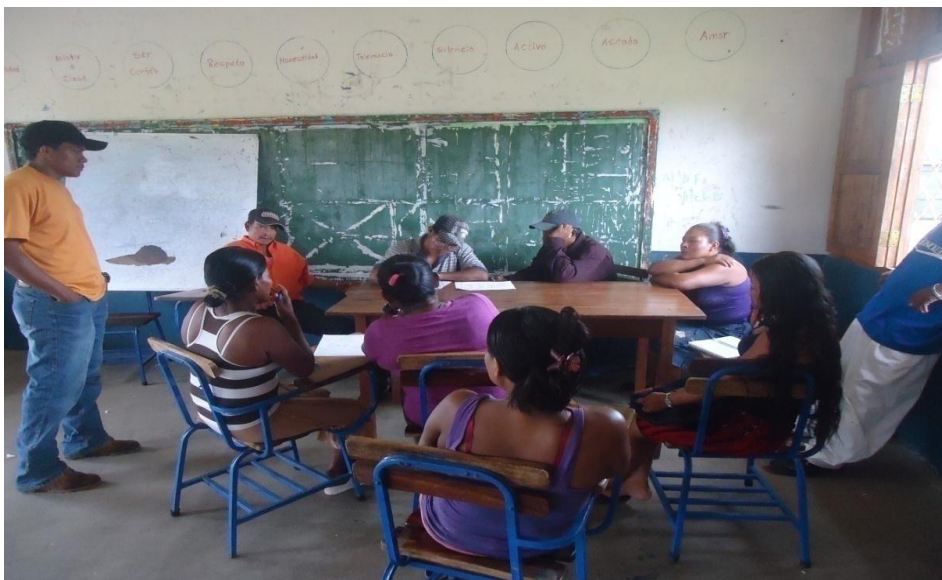
Foto 2. Grupo focal con adultos Awastigni. Mayo 2016