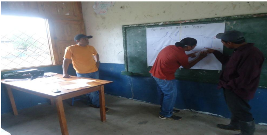
Foto 4. Construyendo el mapa párlate del territorio, Joven líder y presidente GTI.