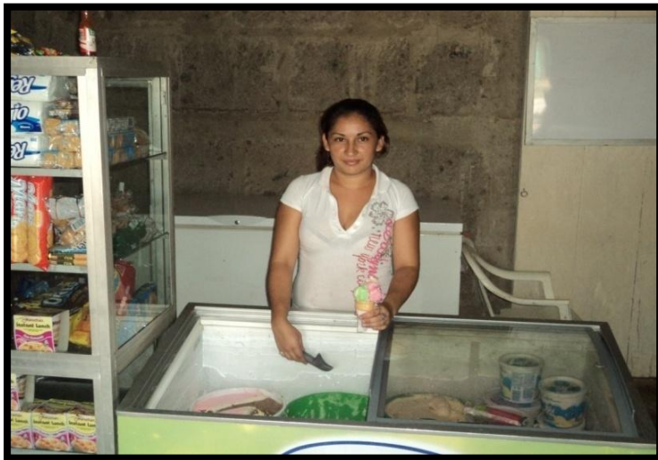
Fotografía 4. Pequeño negocio de una comerciante.