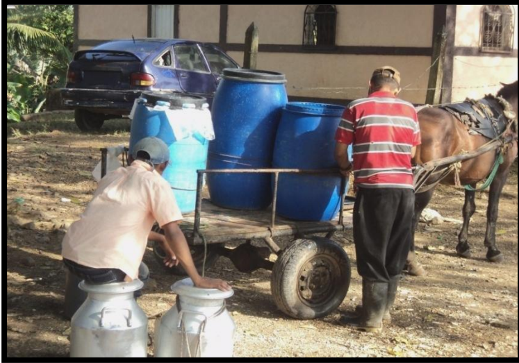
Fotografía 3. Traslado de leche para ser vendida por comerciantes.