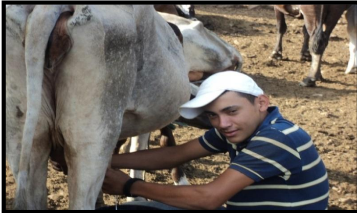
Fotografía 2. Realización del ordeño en una unidad productiva de Santa Rita (Tomada por Nelvin Amizadac Martínez Salas).