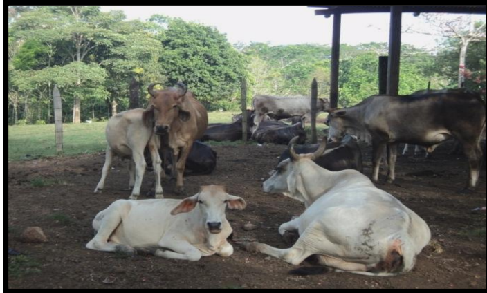
Fotografía 1. Ganado bovino en una unidad productiva de la comunidad de Santa Rita (Tomada por Nelvin Amizadac Martínez Salas).