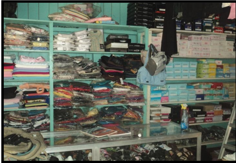
Fotografía 5. Negocio de ropa y calzado (Tomada por Nelvin Amizadac Martínez Salas).