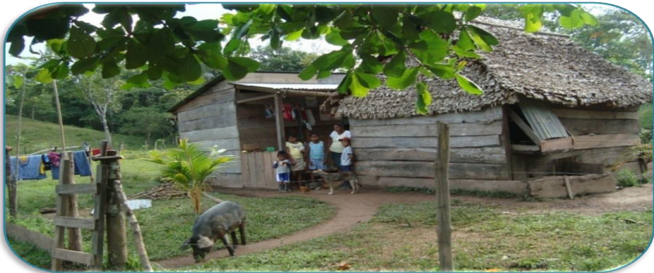
Fotografía 6: Familia entrevistada de la Comunidad de Santa Rosa. Tomada por Meylin Raquel Pizarro Gutiérrez el 24 de Septiembre del 2010.