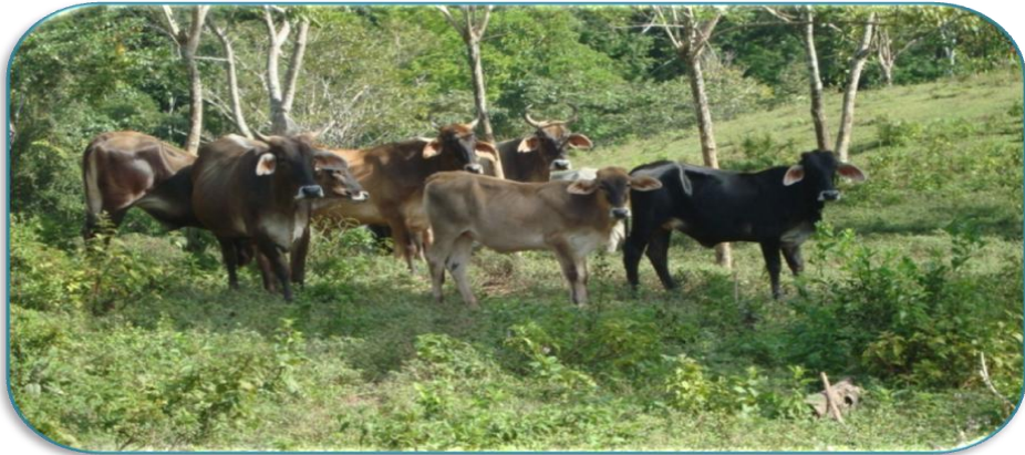
Fotografía 5: Ganado bovino de una finca de la Comunidad de Santa Rosa. Tomada por David Zeledón Palacios el 24 de Septiembre del 2010.