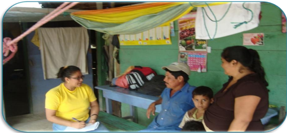
Fotografía 7: Familia entrevistada de la Comunidad de Santa Rosa. Tomada por David Zeledón Palacios el 24 de Septiembre del 2010.