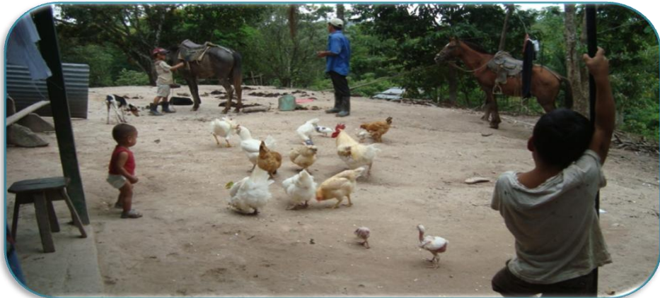
Fotografía 8: Aves de corral (gallinas) de una familia de la Comunidad de Santa Rosa.