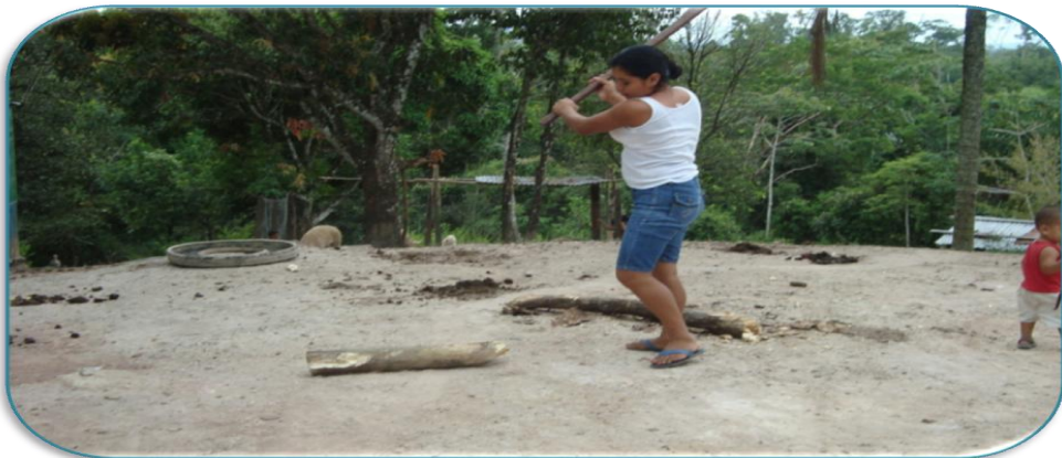
Fotografía 10: Madre de familia entrevistada rajando leña en su casa en la Comunidad de Santa Rosa. Tomada por David Zeledón Palacios el 24 de Septiembre del 2010.