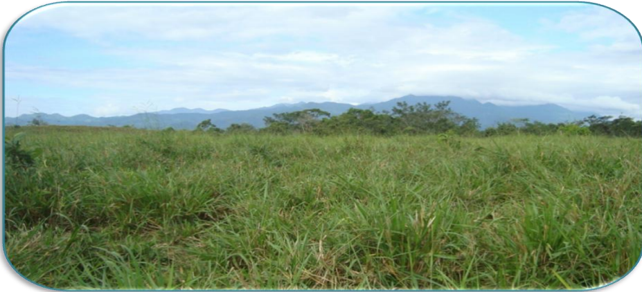
Fotografía 4: Área de pasto en una finca de la Comunidad de Santa Rosa. Tomada por David Zeledón Palacios el 24 de Septiembre del 2010.