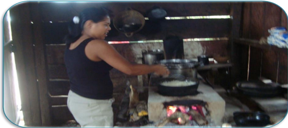
Fotografía 9: Joven realizando los quehaceres de la casa de la Comunidad de Santa Rosa. Tomada por Meylin Raquel Pizarro Gutiérrez el 24 de Septiembre del 2010.