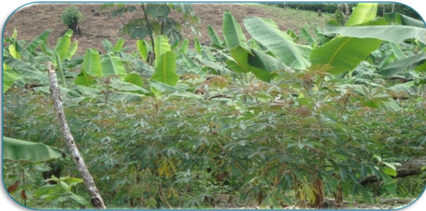
Fotografía 2: Parcela del cultivo de yuca combinada con musáceas en una finca de la Comunidad de Santa de Rosa. Tomada por Meylin Raquel Pizarro Gutiérrez el 24 de Septiembre del 2010.