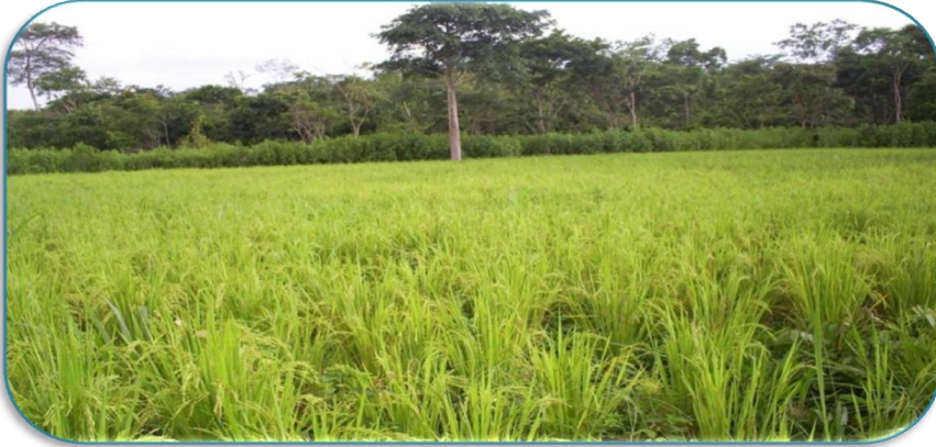
Fotografía 1: Parcela del cultivo de arroz en una finca de la Comunidad de Santa Rosa. Tomada por David Zeledón Palacios el 24 de Septiembre del 2010.