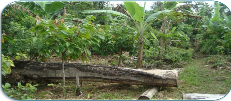
Fotografía 3: Parcela del cultivo de cacao combinada con musáceas en una finca de la Comunidad de Santa de Rosa. Tomada por Meylin Raquel Pizarro Gutiérrez el 24 de Septiembre del 2010.